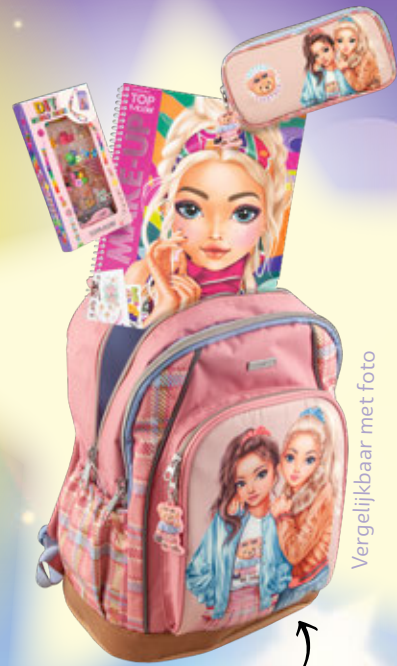
Vergelijkbaar met foto

Stem op je favoriete TOPModel en doe mee aan de verkiezing van TOPModel van het jaar 2024!