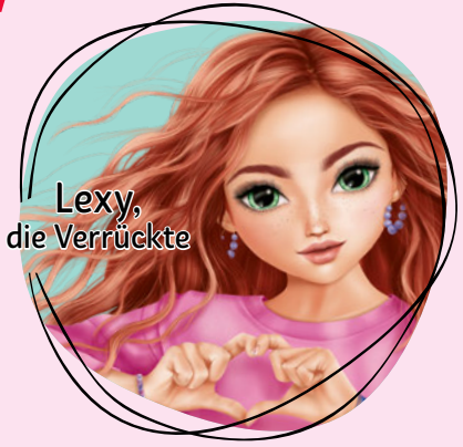
Lexy, die Verrückte

Liebste Weihnachts-Leckerei: Plätzchen mit Marmelade