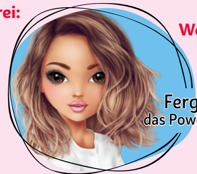
Fergie, das Power-Girl

Liebste Weihnachts-Leckerei: Spritzgebäck