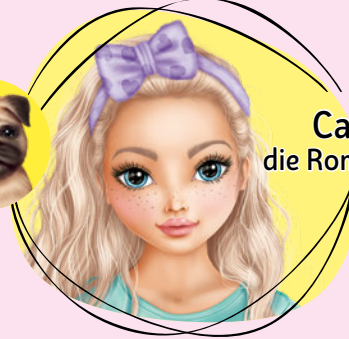
Candy, die Romantische