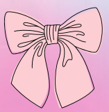
Ariana Grande Sängerin, 31 Jahre

In diesem traumhaften rosa Ballkleid sieht Ariana aus wie eine Prinzessin! Sie trägt in ihrem Look gleich zwei Schleifen : Eine vorne am Kleid, die zweite etwas versteckt unter ihrem Zopf.